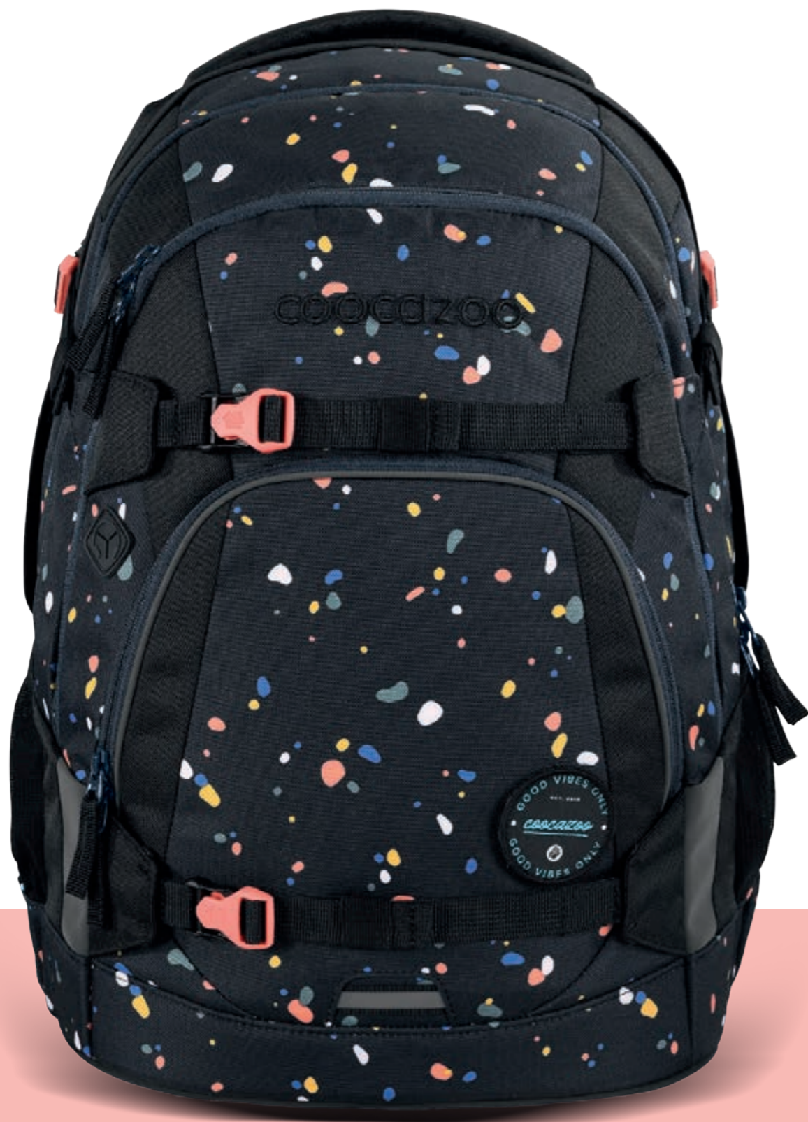
PORTER | MATE | JOKER