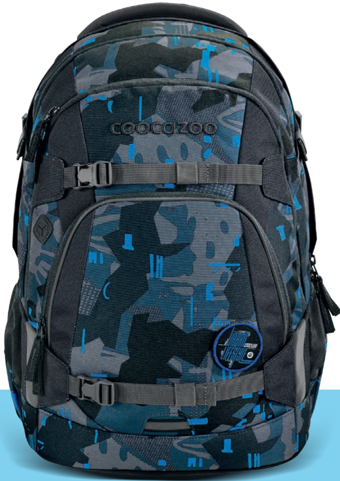
MATE | PORTER