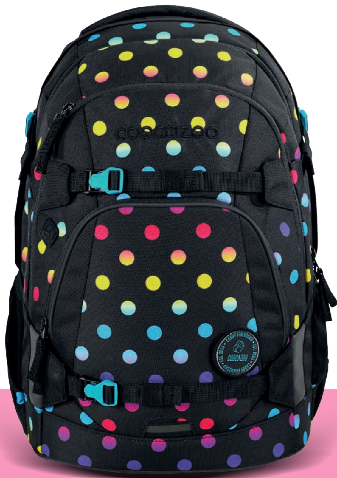
MATE | JOKER