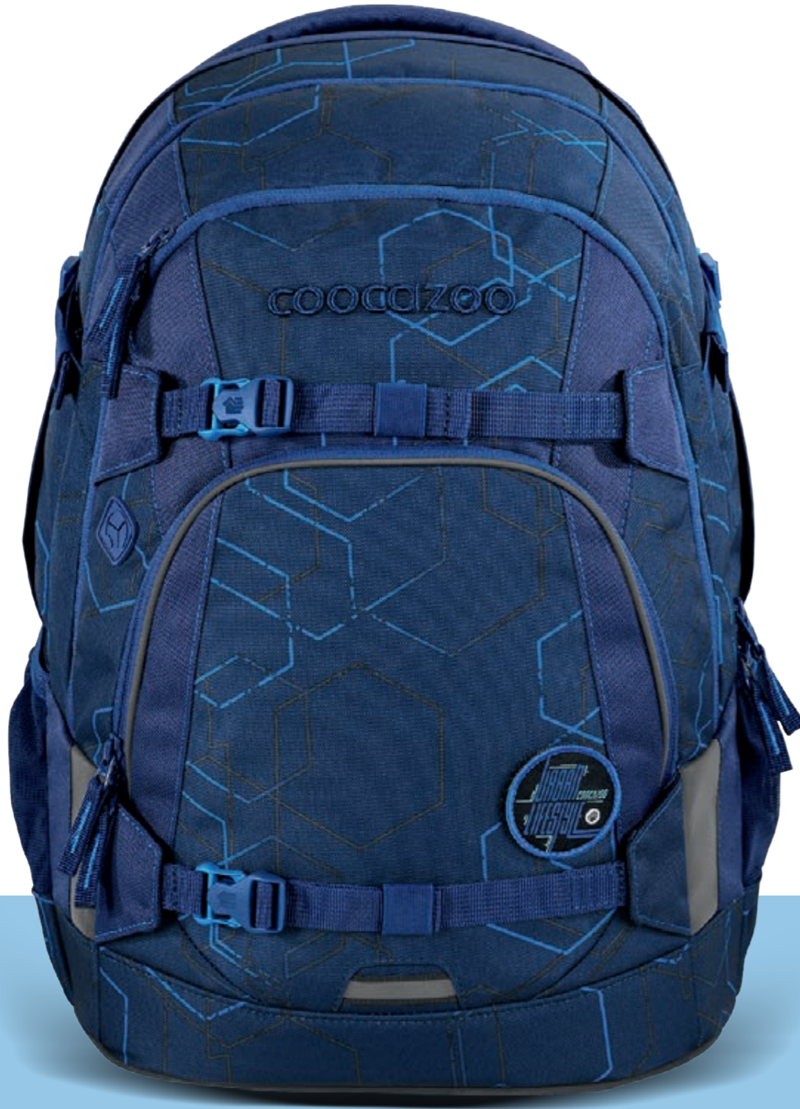
PORTER | MATE | JOKER