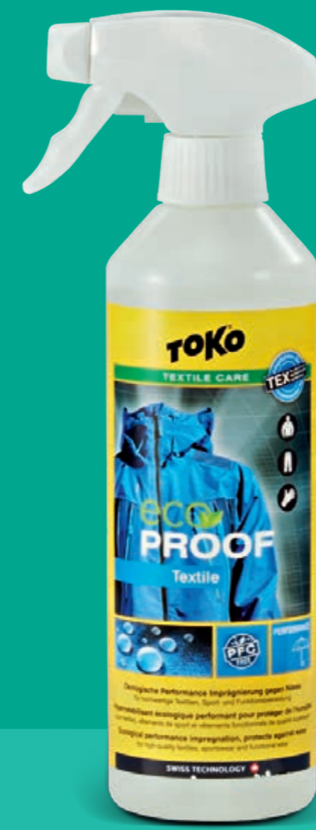
ECO-TEXTILE- PROOF, 500 ml