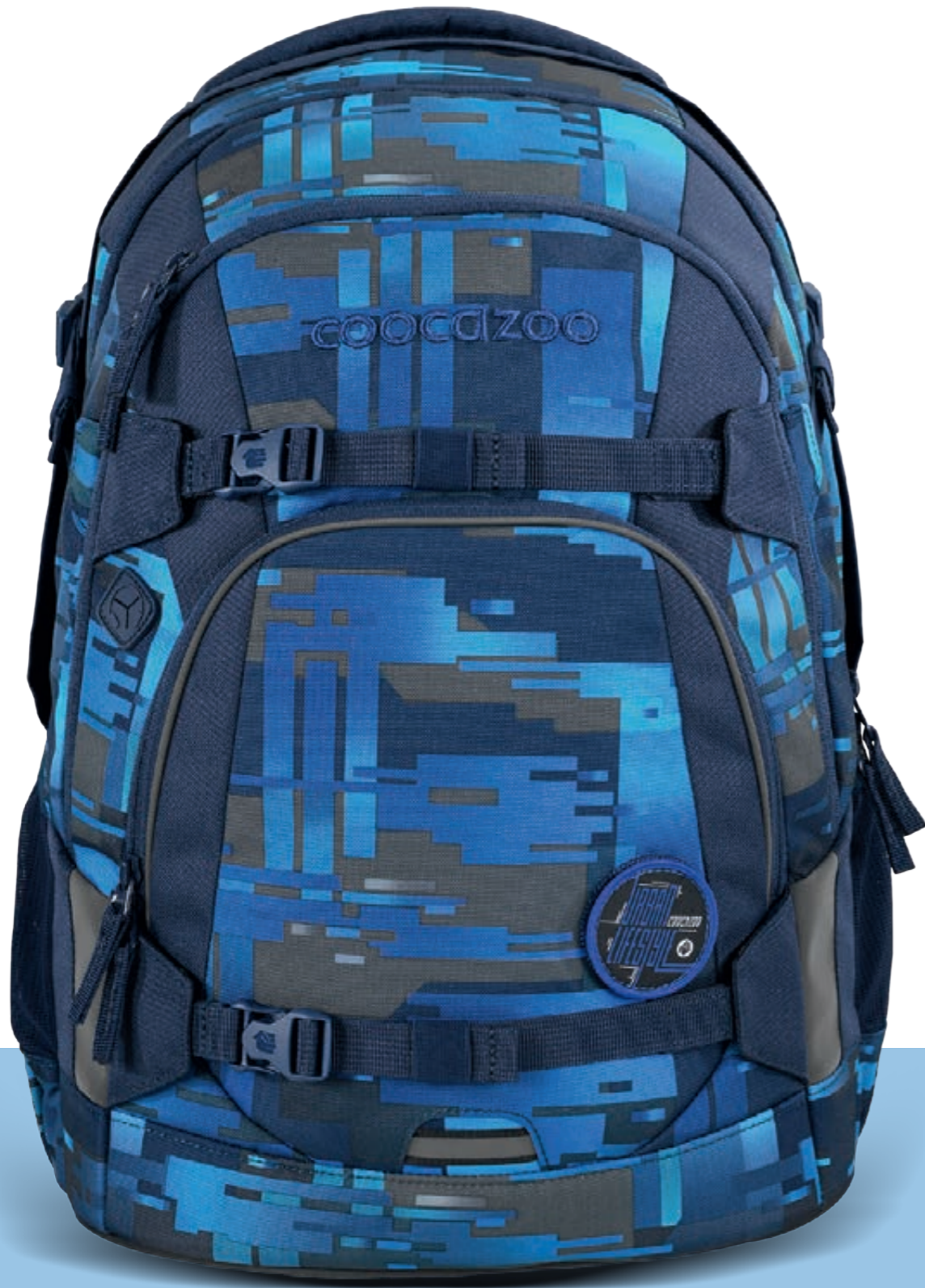
MATE | JOKER