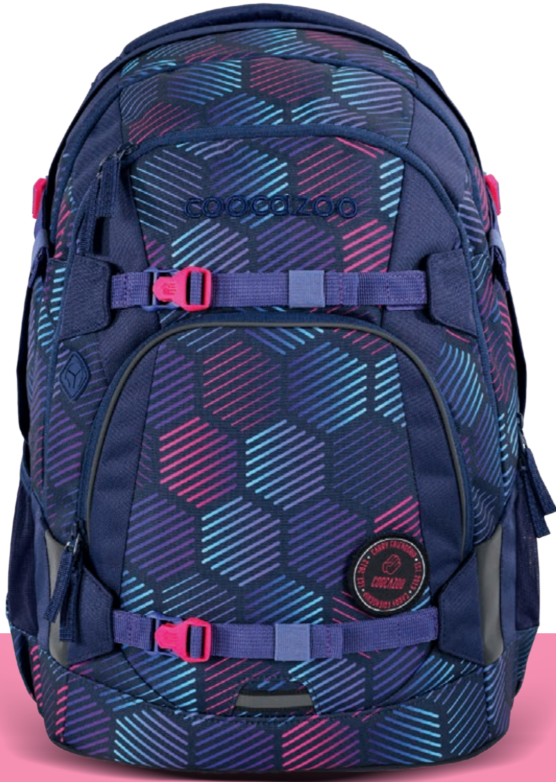
MATE | PORTER