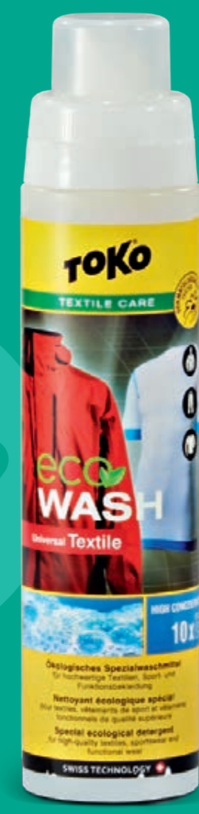
ECO-TEXTILE- WASH, 250 ml