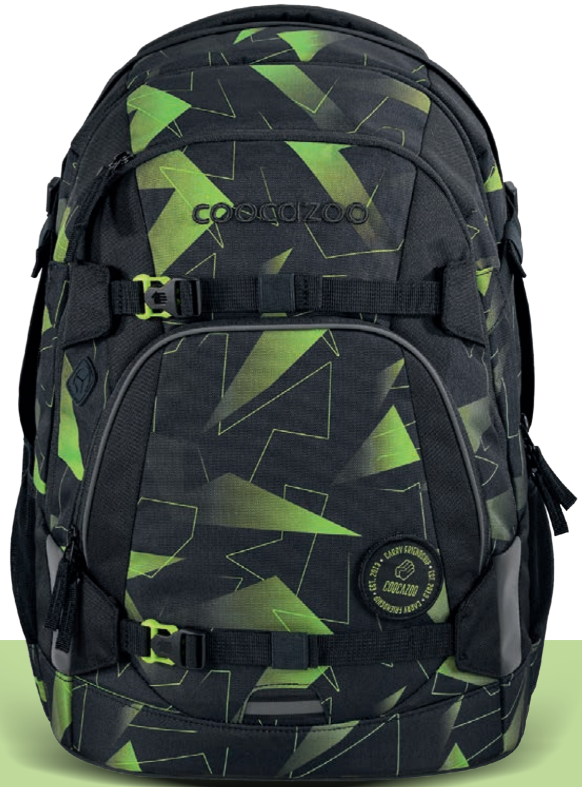
PORTER | MATE | JOKER