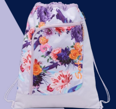
Endless Bloom SAT-SPO-001-NAG 29,99 € UVP*