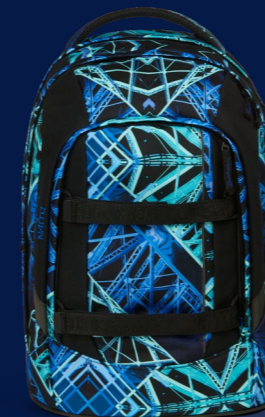
Endless Light SAT-SIN-001-NAB 159,99 € UVP*