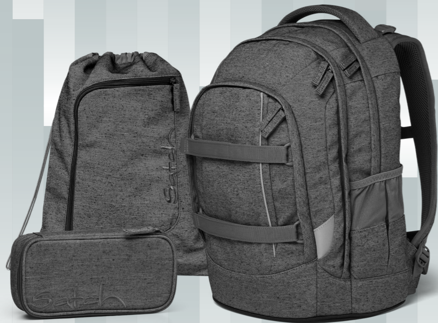
Collected Grey SAT-BSC-001-ZER 29,99 € UVP*