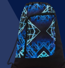
Endless Light SAT-SPO-001-NAB 29,99 € UVP*