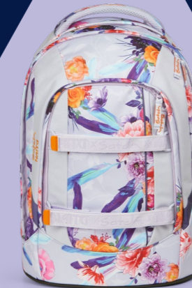
Endless Bloom SAT-SIN-001-NAG 159,99 € UVP*